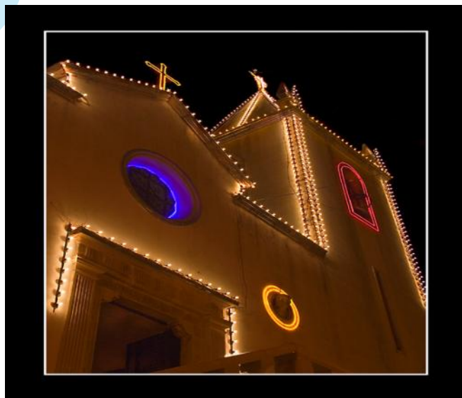
As Igrejas são preparadas a rigor para a Missa do Galo.

*Ainda hoje, os habitantes dos países nórdicos vão à missa de trenó.