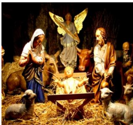
Um presépio simples.

*É uma representação da forma como Jesus nasceu e é montado para recordar que no Natal se celebra o seu nascimento.