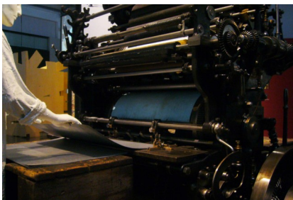
Fabrico das latas de conserva.