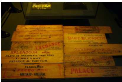
A visita ao museu de Portimão foi muito interessante e divertida!